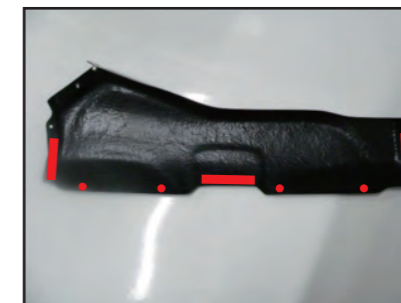
導入ダクトカバーの裏にクッションテープとゴムダンパーを貼り付けます。右図を参照してゴムダンパーを貼り付けてください。