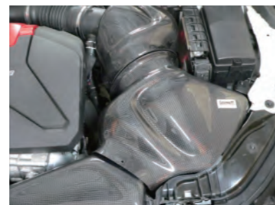
フィルターとフィルターケースを車両に配置します。