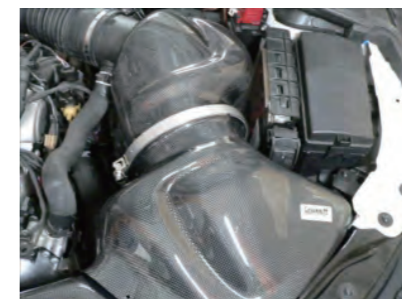
チャンパーボックスとフィルターケースをVクランプで固定します。