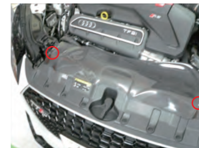
導入ダクトカバーを純正導入ダクトに被せ、純正ボルトで固定します。