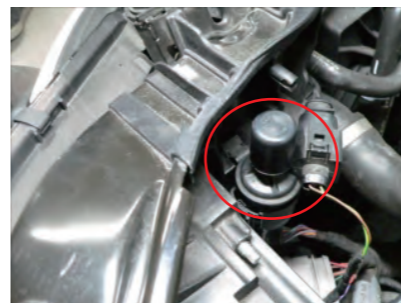
ブリーザーホースを移設します。