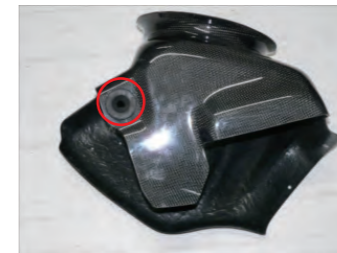
外したゴムブッシュをフィルターケースに1箇所取り付けます。