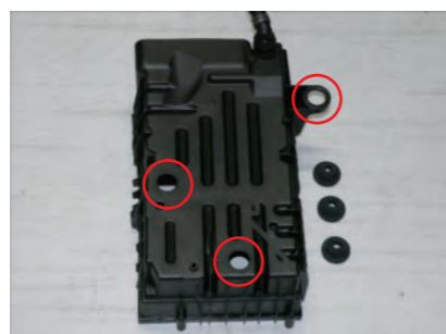
ボックス下部からゴムブッシュを3箇所外します。