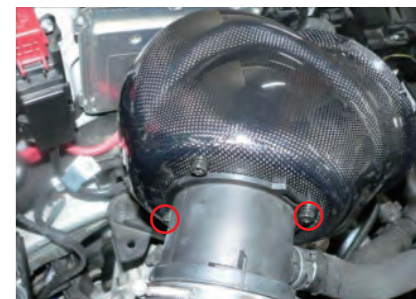
チャンパーボックスを車両に取り付け、ビスAでアダプターと固定します。(Oリングにグリス塗布した状態が作業しやすいです。)