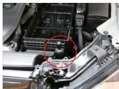
ボックス上部を外します。ブリーザーホースをボックス下部から外します。ボックス下部を外します。