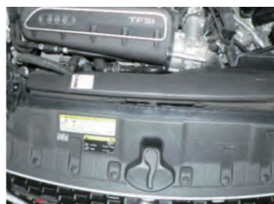
純正導入ダクトをボディに配置します。(ボルトで固定しません。)