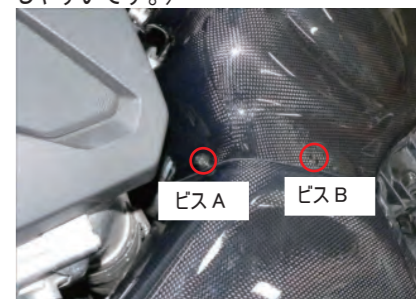
フィルターケースと導入ダクトカバーをビスAとビスBで固定します。