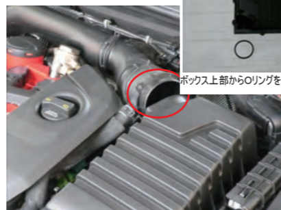
アダプターをボックス上部から外します。(Oリングの抵抗で外しづらいです。)