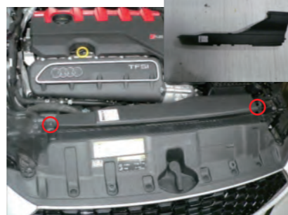
導入ダクトのビス2本を外し、導入ダクトを取り出します。