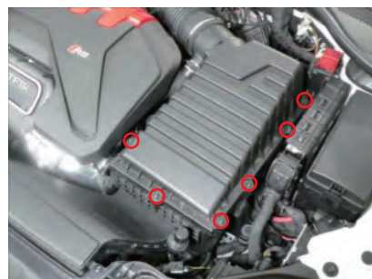
ボックス上部のボルトを8箇所全て緩めます。