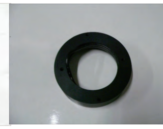
外したOリングをファンネルアダプターの溝に取り付けます。