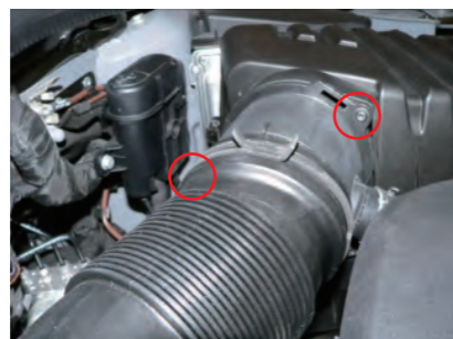
ボックス上部とアダプターを固定してるビスを2箇所外します。