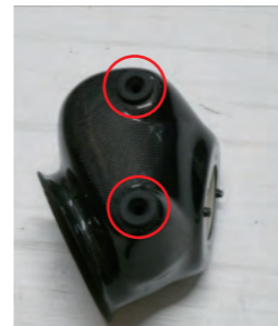
外したゴムブッシュをチャンパーボックスに2箇所取り付けます。