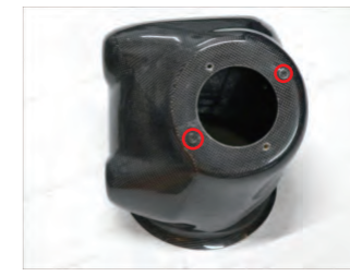
ファンネルアダプターをビスAでチャンパーボックスに取り付けます。間隔の広い方で固定します。